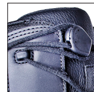
HAIX® Smart Lacing