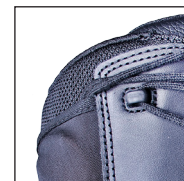
HAIX® Climate System