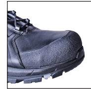
HAIX® Composite Schutzkappe