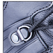
HAIX® 2-Zone Lacing