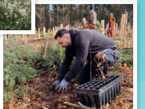
DELTA Zofingen AG pflanzt 950 Bäume. Mit diesem Projekt wollen wir unseren ökologischen Fussabdruck verbessern und einen Beitrag zur regionalen Nachhaltigkeit leisten.

WIR GESTALTEN WEGE, UM SOZIALE VERANTWORTUNG UND WIRTSCHAFTLICHEN ERFOLG ZU VERBINDEN.