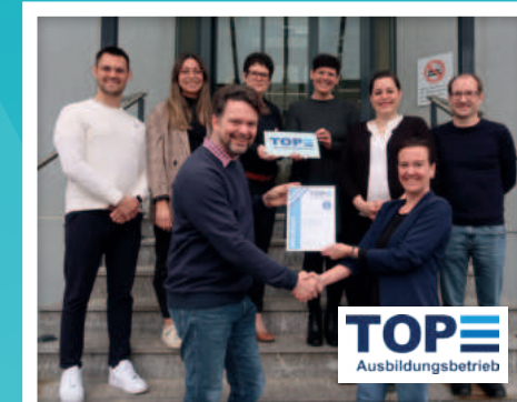
DELTA IST TOP-AUSBILDUNGSBETRIEB Die Zertifizierung der Stiftung TOP-Ausbildungsbetrieb bestätigt unsere hohe Ausbildungsqualität und unser Engagement für junge Menschen.

Wir fördern Chancengleichheit und setzen auf einen Frauenanteil von