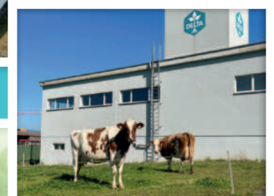
Unsere natürlichen Rasenmäher: Seit 2018 übernehmen Kühe das Rasenmähen auf dem DELTA-Gelände und tragen zur Pflege unserer Grünflächen bei.