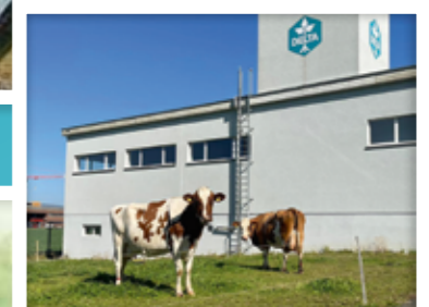
Unsere natürlichen Rasenmäher: Seit 2018 übernehmen Kühe das Rasenmähen auf dem DELTA-Gelände und tragen zur Pflege unserer Grünflächen bei.