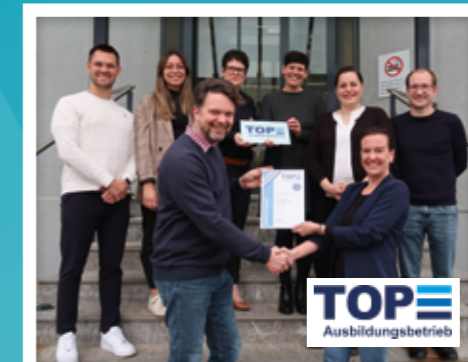
DELTA IST TOP-AUSBILDUNGSBETRIEB Die Zertifizierung der Stiftung TOP-Ausbildungsbetrieb bestätigt unsere hohe Ausbildungsqualität und unser Engagement für junge Menschen.

durch Teilzeitarbeitsmodelle, Remote-Work und Home Office.