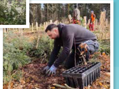
DELTA Zofingen AG pflanzt 950 Bäume. Mit diesem Projekt wollen wir unseren ökologischen Fussabdruck verbessern und einen Beitrag zur regionalen Nachhaltigkeit leisten.

Mit der Gründung der DELTA Academy bieten wir umfassende interne Schulungen und Weiterbildungen an.