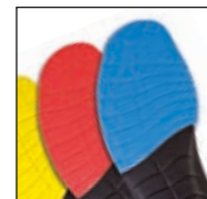
Vario Wide Fit System