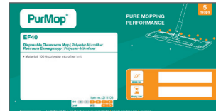
Beutel-Etikett PurMop® EF40