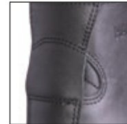
HAIX® FP System