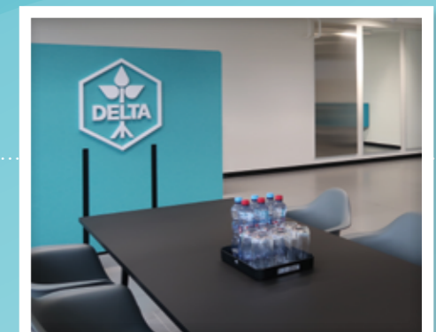
Dans l'optique « Zero Waste », DELTA investit dans des postes de travail modernes et utilise des solutions acoustiques flexibles à base de bouteilles PET recyclées, qui sont fabriquées en Suisse.

Dans cette démarche, nous nous référons à des labels reconnus pour les produits et les services, tels que l'EU Ecolabel, le PEFC, le FSC, le GRS, le Blauer Engel et Fiberpack.