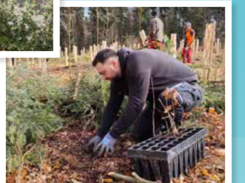
DELTA Zofingen AG plante 950 arbres. Avec ce projet, nous voulons améliorer notre empreinte écologique et apporter une contribution à la durabilité régionale.

À travers la fondation de la DELTA Academy, nous proposons des formations initiales et continues étendues.