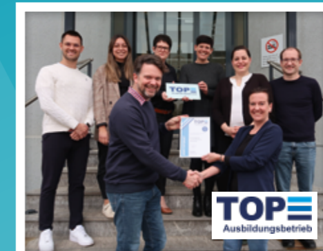
DELTA EST UNE TOP ENTREPRISE FORMATRICE La certification de la fondation TOP Entreprise formatrice atteste notre haute qualité de formation et notre engagement en faveur des jeunes.

à travers des modèles de travail à temps partiel, le télétravail et le bureau à domicile.