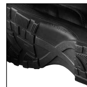
Développement d'une nouvelle semelle