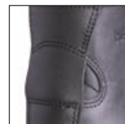
Protection du tendon